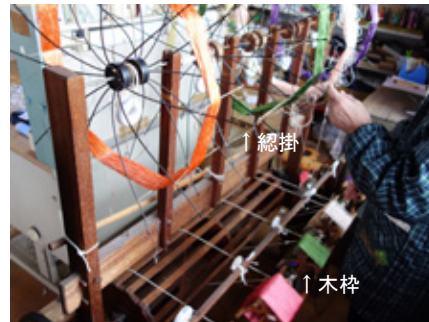
糸繰り：総掛に糸をかけ、木枠に糸を移す作業