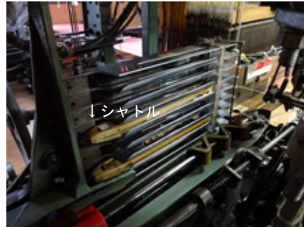
シャトル：経糸の間に、緯糸を通すのに使われる道具