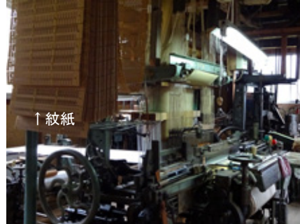
紋紙を使用した織機