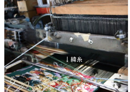
織機で織る時は、裏から緯糸を通していく