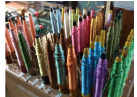
管：糸を巻いてシャトルに入れ緯糸として使用する道具