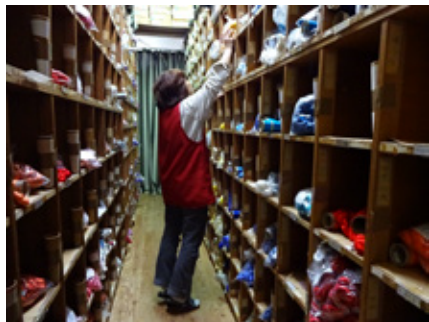
糸棚：緯糸を保管しておく棚