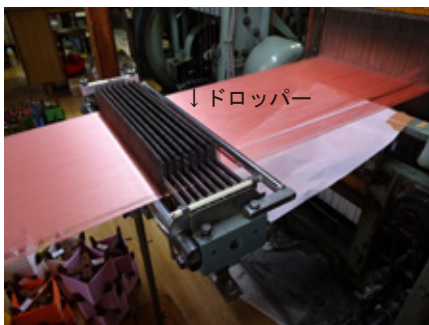
ドロッパー：経糸切れた事を検出する装置