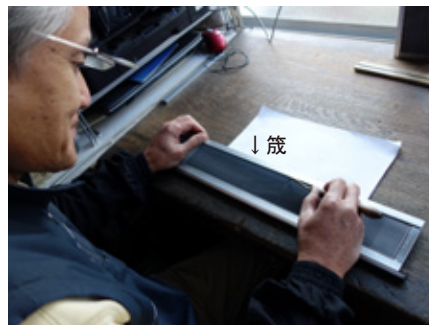
箄：経糸を整え、緯糸を打ち込む織機の部品