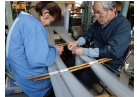
経糸つなぎ：約1000本ある糸を繋いでいく作業