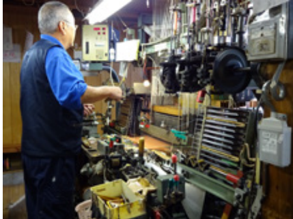
織物を織るダイレクトジャガード織機

織物を織るには様々な工程と、それに携わる人々があります。その一部を紹介いたします。